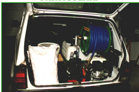
LA GRANDE COMPATTEZZA È LA PECULIARITÀ DI QUESTA MACCHINA