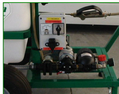
VERSIONE ELETTRICA A 12 VOLT